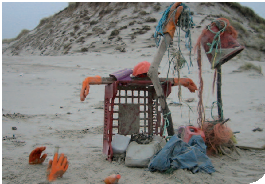
Müll am Strand: Sieht lustig aus - ist es aber nicht

Zuerst trifft es die Tiere: Vögel können Plastikteilchen nicht von Nahrung unterscheiden, füttern damit ihren Nachwuchs und sind bei ständigem Sättigungsgefühl unterernährt. Fast alle Nordseevögel sind heute von diesem Problem betroffen. Aber nicht nur Tiere sind die Verlierer: Der