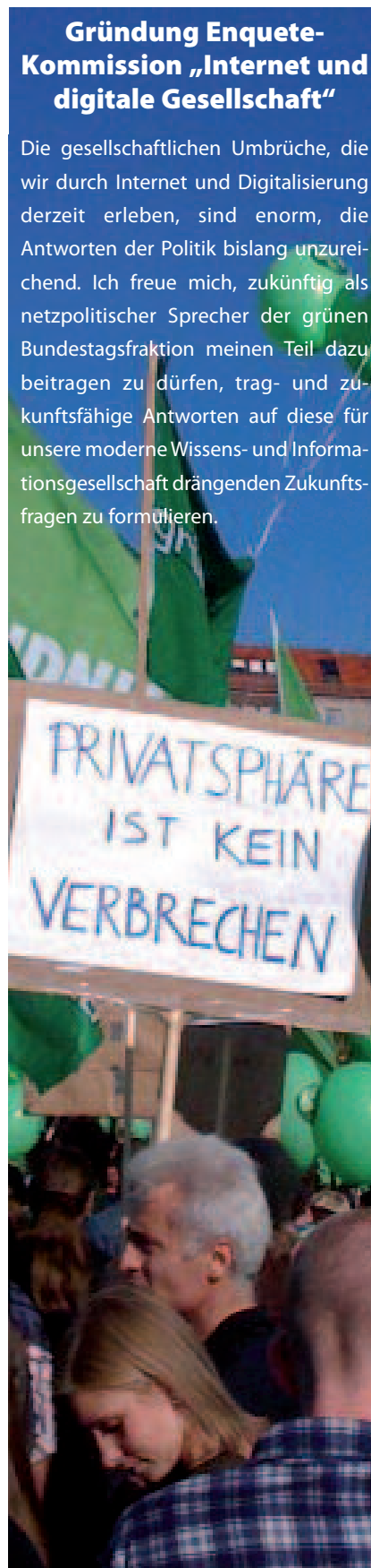
Grüne auf der Demo "Freiheit statt Angst" am 12. September 2009 in Berlin

Die gesellschaftlichen Umbrüche, die wir durch Internet und Digitalisierung derzeit erleben, sind enorm, die Antworten der Politik bislang unzureichend. Ich freue mich, zukünftig als netzpolitischer Sprecher der grünen Bundestagsfraktion meinen Teil dazu beitragen zu dürfen, trag- und zukunfts-fähige Antworten auf diese für unsere moderne Wissens- und Informationsgesellschaft drängenden Zukunftsfragen zu formulieren.