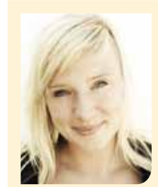
Luise Amtsberg Bündnis 90/Die Grünen

Senat, dem Innenministerium und der Küstenwache über eine bessere Seenotrettung und einem Besuch in Europas größtem Flüchtlingslager in Mineo auf Sizilien waren wir für mehr Solidarität unter den europäischen Mitgliedsstaaten. Auf diesen Erfahrungen baute auch meine erste Rede im Bundestag auf, in der ich unter anderem eine Reform von Frontex angemahnt und eine humanere EU-Flüchtlingspolitik gefordert habe. Angesichts der immer schärfer werdenden humanitären Lage in Syrien, versuchen wir gerade mit Hochdruck den Bundesländern den Rücken zu stärken und das Kontingent auszubauen.