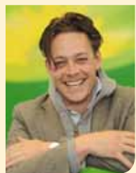
Dr. Konstantin von Notz, Stellv. Fraktionsvorsitzender und Netzpolitischer Sprecher

Die Grüne Bundestagsfraktion hat auf ihrer diesjährigen Neujahrsklausur in Weimar u.a. die Schwerpunkte ihrer inhaltlichen Arbeit des ersten Halbjahres der neuen Legislaturperiode festgelegt. Als stellvertretender Fraktionsvorsitzender und Koordinator des Arbeitskreises III freue ich mich sehr, dass sich die Grünen Bundestagsfraktion darauf verständigt hat, sich in den nächsten Monaten neben der Energiewende vor allem dem Schutz und dem Ausbau unserer digitalen Bürger- und Grundrechte besonders intensiv widmen zu wollen.